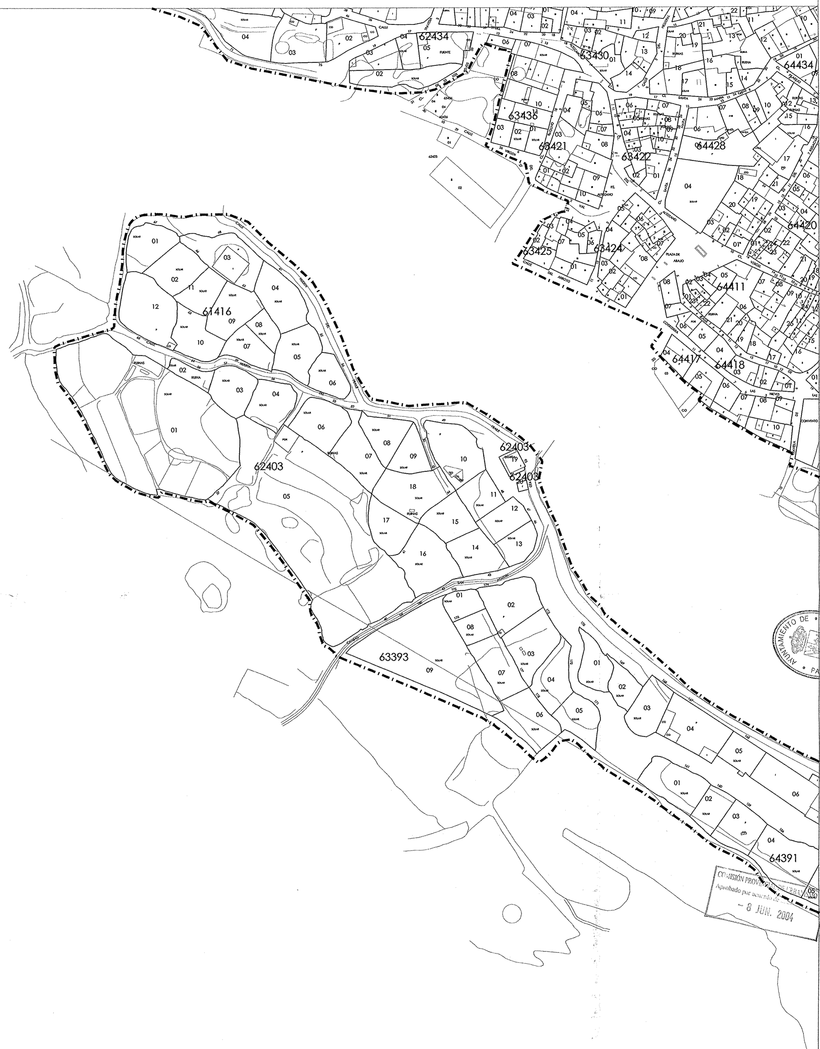
GRAFICO DE HOJAS